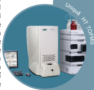
Unique HT TOFMS