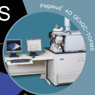
Pegasus® 4D GCxGC-TOFMS