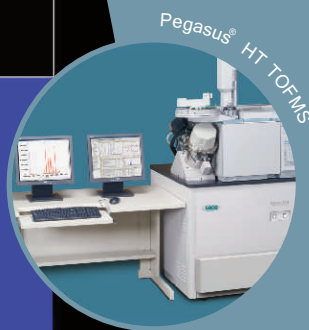
Pegasus® HT TOFMS